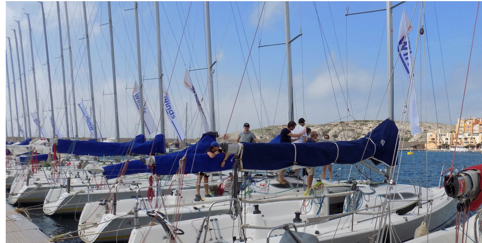
>>> Notre flotte monotype de 20 Grand Surprise

Un circuit de régates locales et nationales d'envergure, pour se challenger sur tous les tableaux.